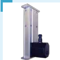
Motorisierter Lift für die automatisierte Höhenverstellung der Kamera bei Pro- duktwechsellinien, Hub bis zu 200 mm.