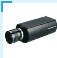
Hochauflösende Kameras für die Inspektion von großen Objekten.