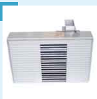
Klimageräte für Electronic Racks und/oder Kameras.