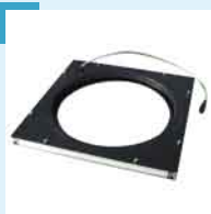
Dunkelfeldbeleuchtung mit 2 Ebenen (rot/blau) für runde Teile mit max. Durchmesser 180 mm.