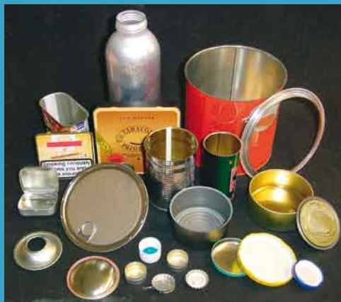
ibea's Compact ViS inspiziert eine große Auswahl an Verpackungsprodukten und Stanzteilen