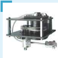
Motorisiertes Zoom- Objektiv für die automatische Auswahl verschiedener Durchmesser (0-200 mm).