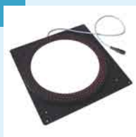
Dunkelfeldbeleuchtung mit 3 Ebenen (rot/grün/ blau) für runde Teile mit max. Durchmesser 120 mm.