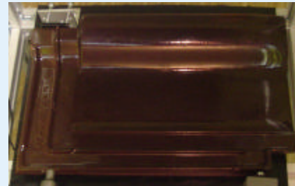
Bild des Ziegels mit einer CCD-Kamera

Aufgrund der kurzen Einkoppelzeit von wenigen 100 ms eignet sich das System sehr gut zur automatisierten Kontrolle. Taktraten bis zu 300 ppm sind möglich..